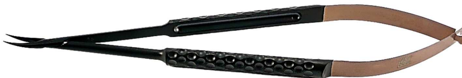
0,2 mm Nadelhalter mit CERAFINE®-Beschichtung schwarz/ bronze