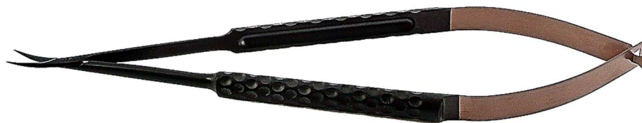
Federschere SUPERFINE-Blatt mit CERAFINE®-Beschichtung schwarz/ bronze

Weitere Informationen finden Sie unter: www.redam-instrumente.de/pinzetten-gracilis.html